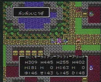
© 1990 ARMOR PROJECT/BIRD STUDIO/CHUNSOFT/SQUARE ENIX All Rights Reserved.

大和絵もドラゴンクエストも、屋根を取り払った俯瞰図法や、奥を小さく、手前を大きく、という遠近法からかけ離れ、登場人物が同じ大きさで点在するという手法で描かれている。