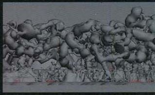
どの視点から写しても、平面的な絵画表現にするために(左)、木々はこのような形となった(上)。「きっと、日本の先人達は、主観でもって、こんなふうに見ていたんじゃないかな。仮想の森は、幹や葉が盛り上がった筋肉のように生々しい。