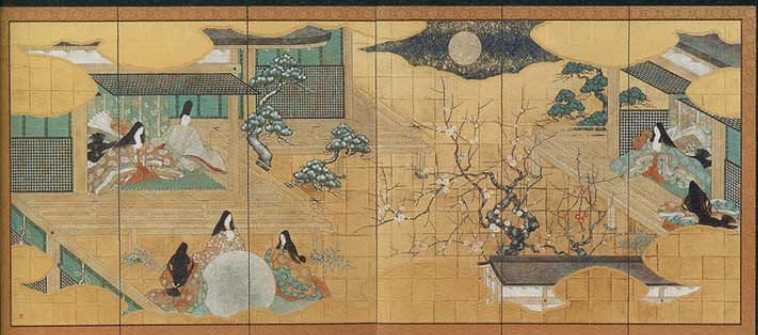
源氏物語解風 朝顔「雪まろび」より 作者：坂上楠生

「正統的な美術教育なんか全く知らないゲームの制作者たちが、実は日本の伝統を受け継いでいたんですよ！」 猪子氏は興味深い自論を展開してみせる。